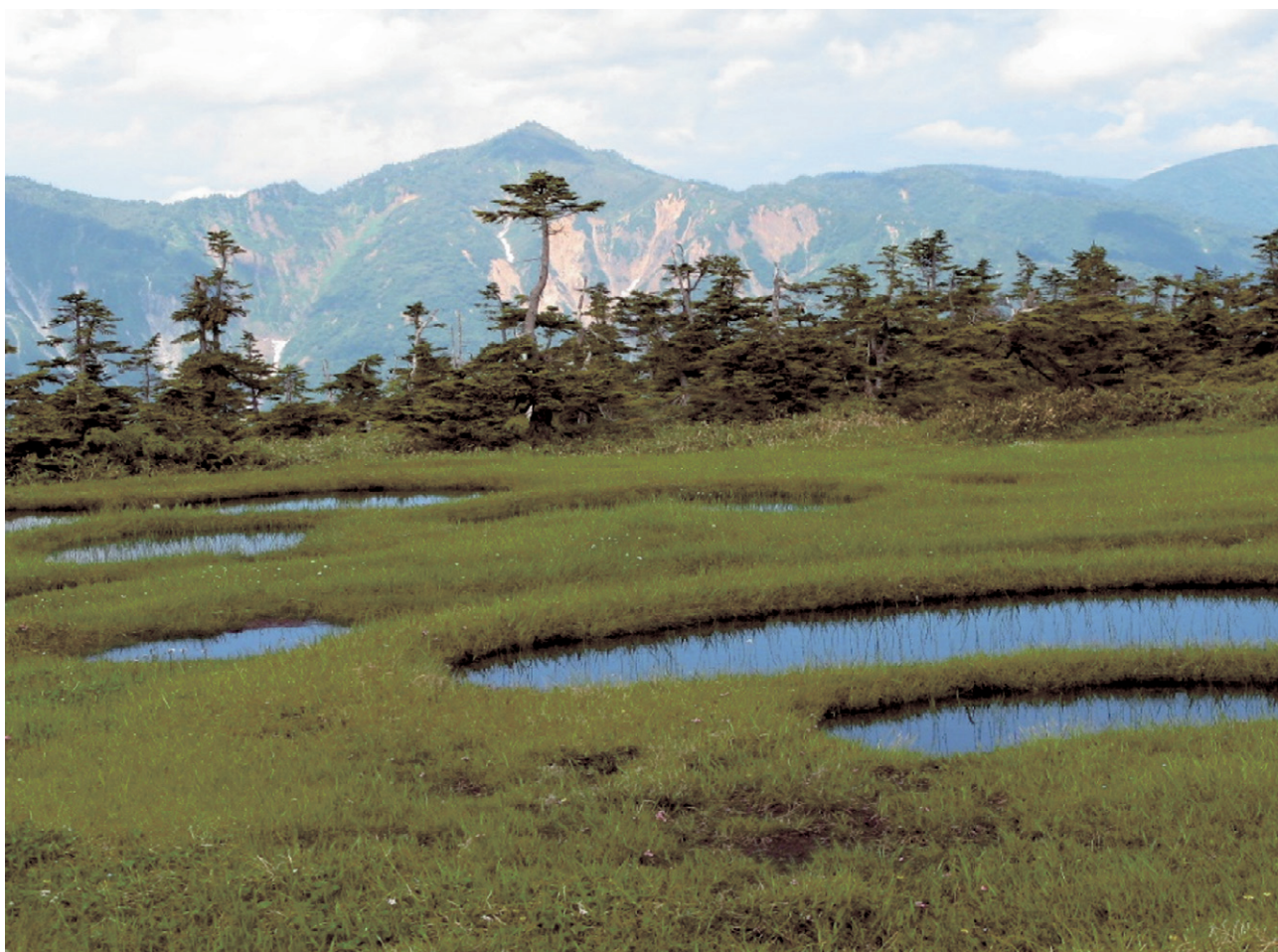
【苗場山山頂の池塘と鳥甲山】

期日：令和 6 年 9 月 21 日(土) ~ 23 日(月) 会場：南魚沼郡湯沢町