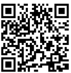
プッシュ型通知サービスについて