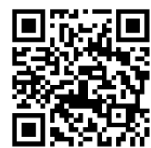
気象庁ホームページ