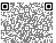
噴火速報について