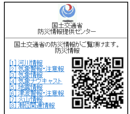
防災情報提供センター 携帯端末向けホームページ (Top)